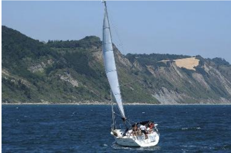
Gli appuntamenti al San Bartolo sono in programma da oggi a domenica

Pace , arte e natura: questa è la triade di valori che l'associazione pesarese 'Fondazione Oasi' ha scelto per rappresentarsi e, allo stesso tempo, per condividere con i cittadini. Inizierà da stasera, infatti, l'evento 'Ecofest Experience', una full immersion all'interno della natura e di tutte le sue sfaccettature. L'evento, che andrà avanti fino a domenica 5 giugno, ha un programma vasto e totalmente dedicato al rispetto dell'ambiente. Le attività si svolgeranno tutte sul Monte San Bartolo, luogo simbolo della tutela dell'ambiente, e cominceranno dalle 9, con momenti di yoga ed attività ricreative, fino alle 23.30. Nella giornata di oggi, inoltre, alle 16, vari artisti